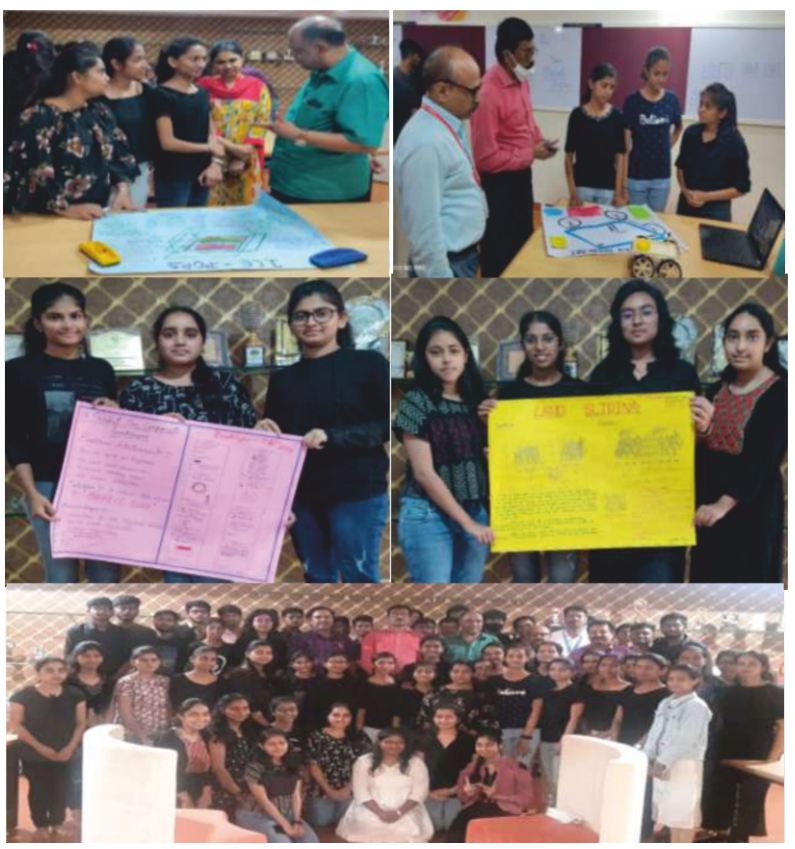
Prototype Design Activity for First Year - B section students in Innovation & Design Thinking Course, conducted on 12 April 21, 2022.

Introductory Presentation for the subjects of 6^{th} and 8^{th} semester was conducted on /04/2022. 6^{th} and 8^{th} semester handling faculties were involved in the course presentation.